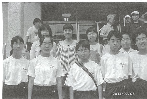
庚午中ボランティア