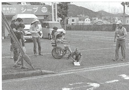
▼道路にはみだした木